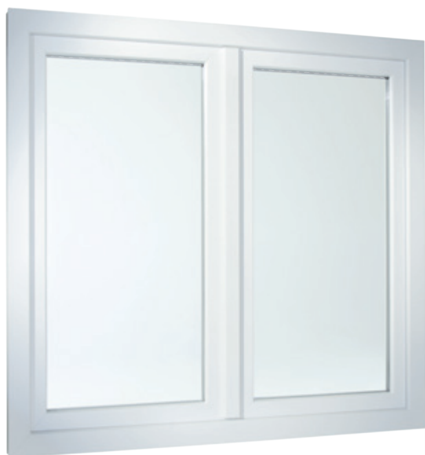
Dvoukřídlové okno s plošně odsazeným křídlem.

Také jeho technické vlastnosti jsou přesvědčivé. Vícekomorové profily využívají izolační vlastnosti vzduchu a splňují tak nejvyšší požadavky na zateplení. Nezajišťují pouze příjemné klima v místnosti za každého počasí, ale i především v zimě pomáhají také značně snížit náklady na vytápění.