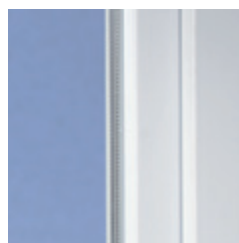
Klasický design s lehce zaoblenými hranami.

Moderní plastová okna z profilů VEKA představují ideální řešení pro každý dům. Klasický design systému SOFTLINE 70 s lehce zaoblenými hranami je nadčasový a skvěle ladí s nejrůznějšími architektonickými styly, ať už jsou moderní nebo tradiční, u novostaveb a nebo u rekonstrukcí.